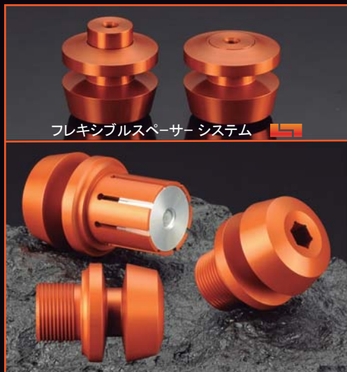
フレキシブルスペーサーシステム

スライダー本体は強度に優れたジュラルミン製。不意に起こった衝撃を滑らせて分散し、フロントフォークボトムケース及びスイングアームへのダメージを軽減します。また、本体は6mmの溝幅を持つスタンドフック構造になっており、レーシングスタンドを掛ける事によって車体のメンテナンスを容易に行えるようになっております。カラーはKTMのイメージカラーのオレンジ。デザインではKTMならではの特徴的なシャープでソリッド感を演出しております。